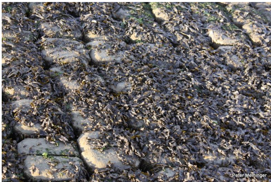
Dijktraject Suzannapolder. Wieren op recent aangebracht Hill blocks.