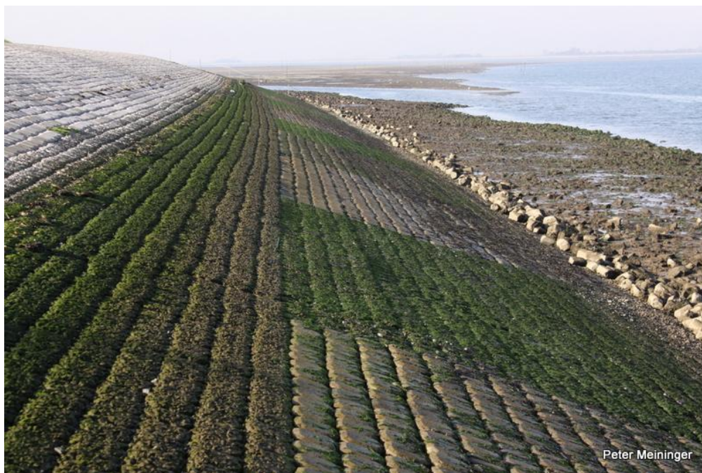
Dijktraject Suzannapolder. Proefvakken Hogeschool Zeeland.

De aannemer heeft schade aan 'kwalificerende habitats' zo veel mogelijk voorkomen, heeft netjes gewerkt en het dijktraject (wat betreft "ecologie") – na enkele kleine te nemen maatregelen - naar wens opgeleverd.