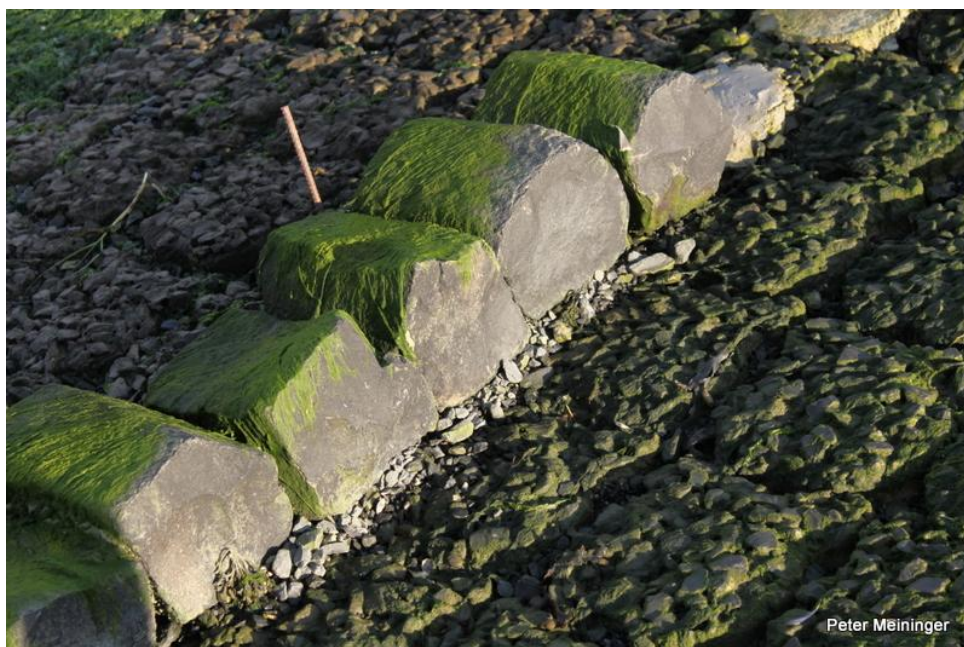
Dijktraject Suzannapolder. Getransplanteerd basalt met groefwier. Te verwijderen steenslag!